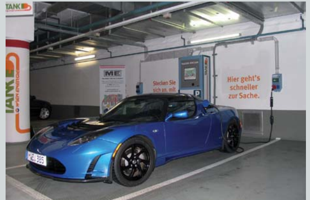
Referenzanlage: Parkhaus mit 8 Ladeplätzen, 1x mit Schnellladung 5x32A, Garage am Hof / Wien 1