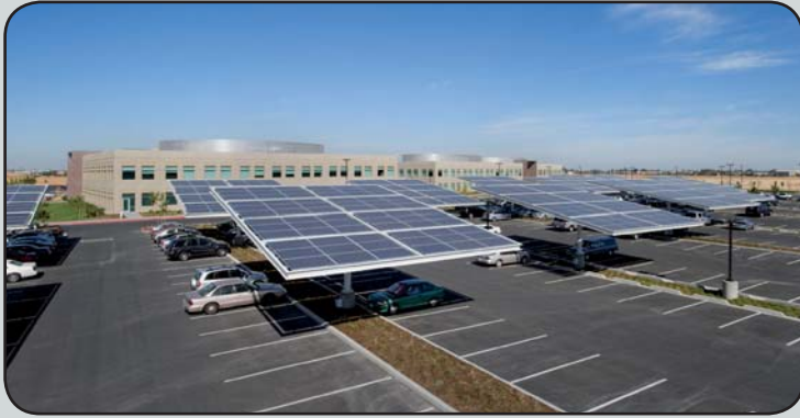
Großparkflächen im Freien