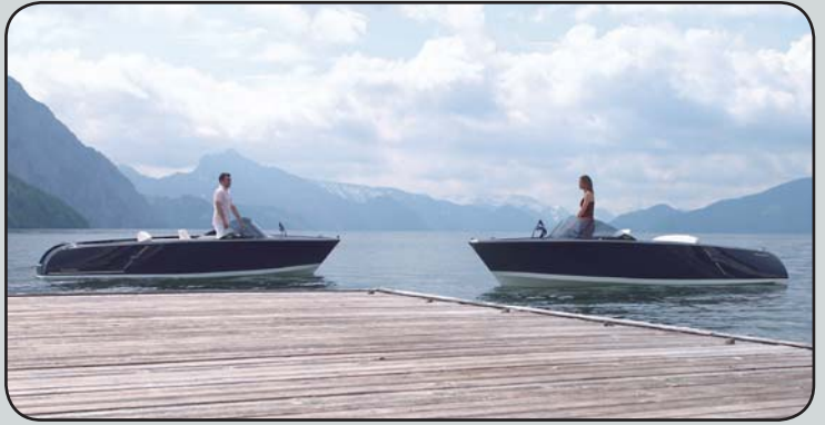
Bootsanlegeplätze für Elektroboote