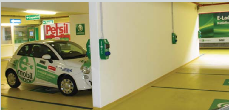
Referenzanlage: Parkhaus mit 12 Ladeplätzen, Garage am Hauptbahnhof / LDZ Linz

Optional: Systemschnittstellen nach Kundenwunsch auf Anfrage!