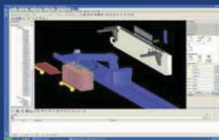
Optimierung ohne Ausschussproduktion oder Fertigungsstillstand durch vollständige Simulation in 3D von der Platinenaufnahme an.