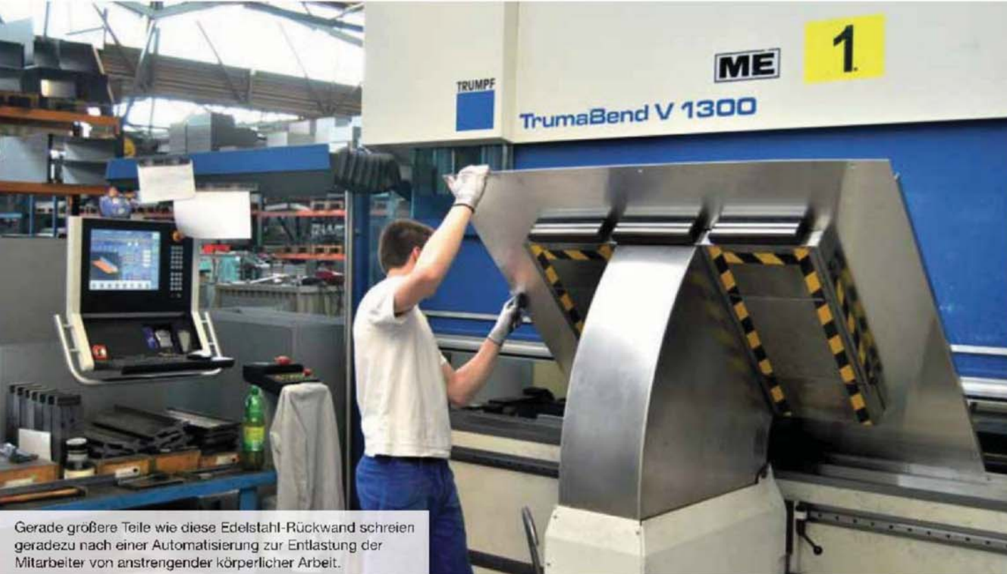
Gerade größere Teile wie diese Edelstahl-Rückwand schreien geradezu nach einer Automatisierung zur Entlastung der Mitarbeiter von anstrengender körperlicher Arbeit.

Die von TRUMPF für den BendMaster angebotenen Greifer in Vakuumtechnik lassen sich ohne Endposition um ihre eigene Achse drehen. Zur Verarbeitung unterschiedlicher Werkstücke werden diese in verschiedenen Größen in einem Greiferständer vorgehalten und nach dem Laden eines neuen Auftrags durch die Biegezone automatisch gewechselt. Zudem ist die Maschine mit Umgreifkonsolen ausgestattet, die sich parallel zur Hauptzeit positionieren, um das Werkstück abzustützen, wenn es gewendet werden muss.