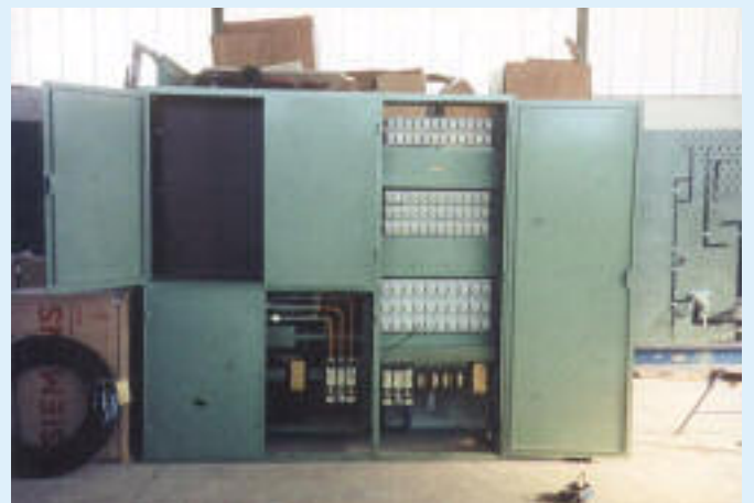
1967 einer der ersten Wandlerschränke die aus Winkeleisen, Blech und Hammerschlag- Lackierung hergestellt wurden.