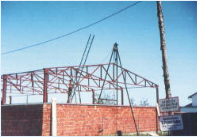
1966 Stahlbau für Werkstätte 150m 2 selbst hergestellt.