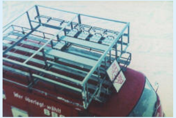
1966 Transport der Verteiler