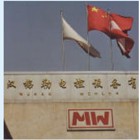
1992 Beginn der Erzeugung von Verteilern für den chinesischen Markt in Wuhan