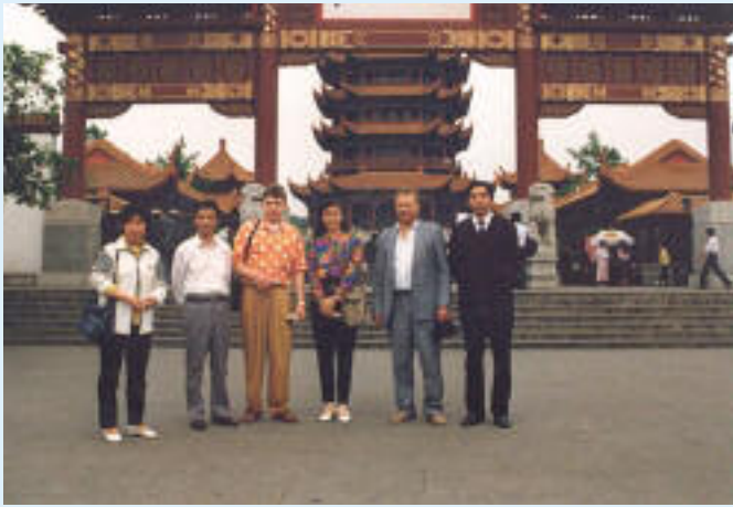
1990 erste Kontakte in China