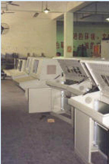
Elektroabteilung in China