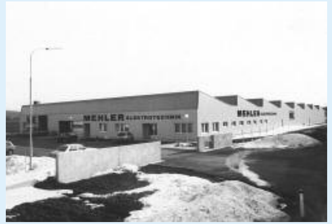
Nov. 1984 Fertigstellung der neuen Halle Lange Gasse 3