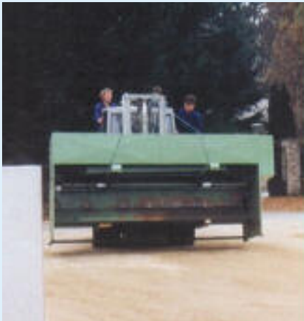
1984 Übersiedlung von Schulstraße 5 in die Lange Gasse 3