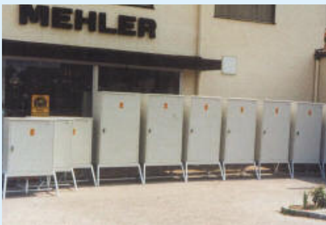
1982 Baustromverteiler aus Aluminium für Großbaustelle in Südafrika