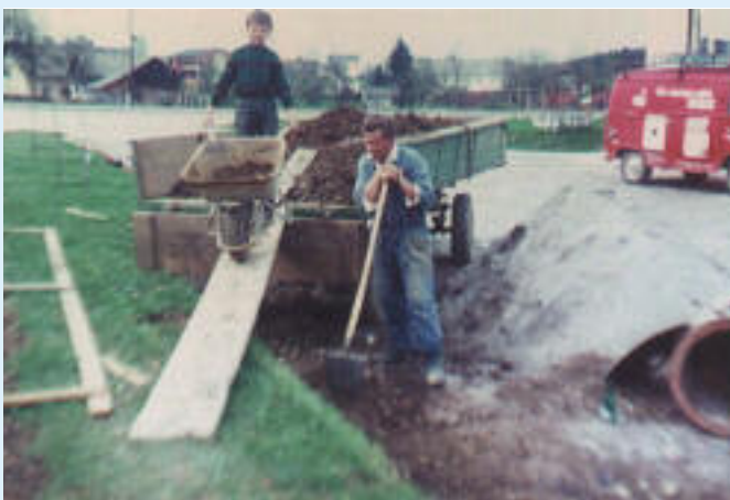
1966 Zubau einer Werkstätte 150m 2 Fundament selbst mit der Hand ausgegraben