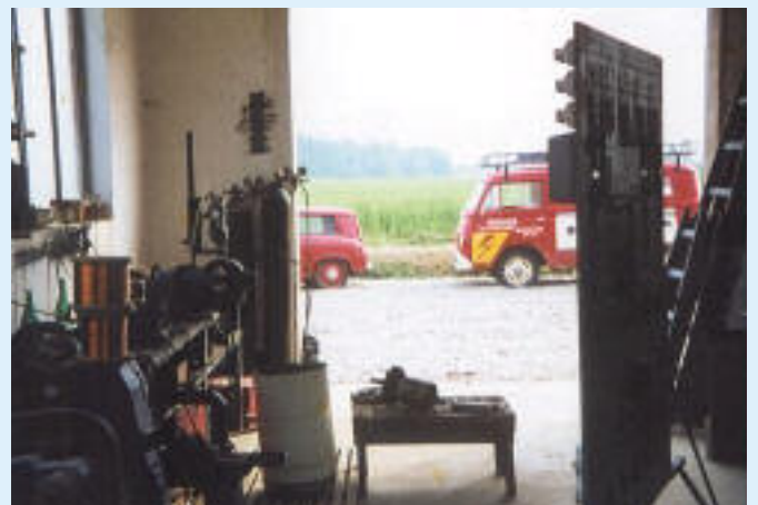
kleine Werkstätte im Neubau 1964 ca. 60m 2