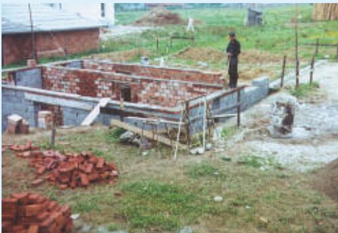
Mai 1963 erste Baustelle Neubau der Firma in der Schulstraße 5 in Wolforn