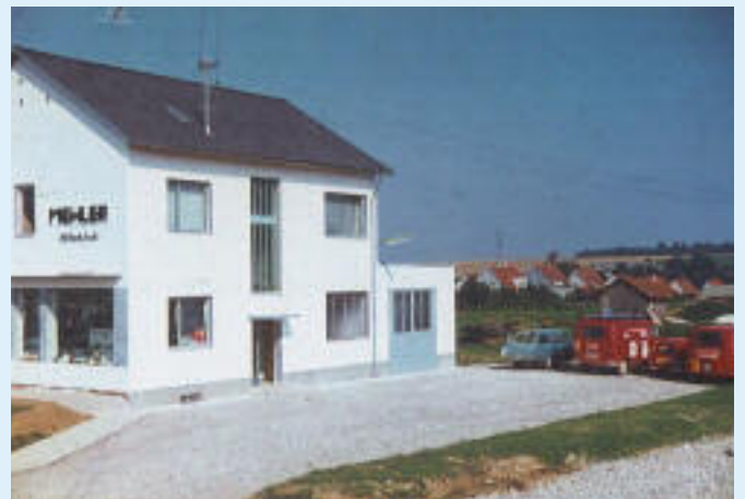
November 1963 Übersiedlung in den Neubau