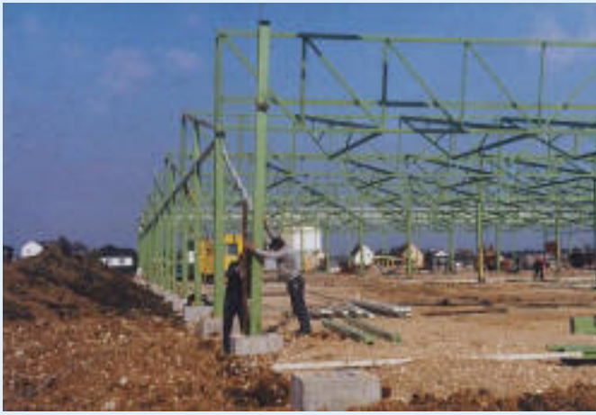
1984 Neubau Lange Gasse 3 in Wolfers 5000m 2 Halle