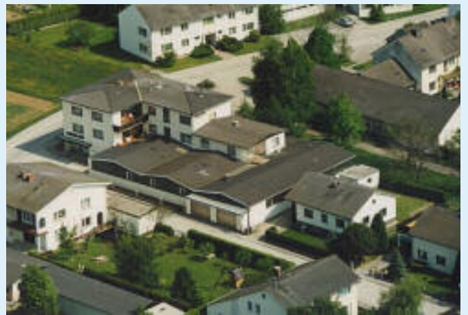
1980 Gesamtansicht der Firma Schulstraße 5 Heute Ausstellungsraum und Lagerhalle