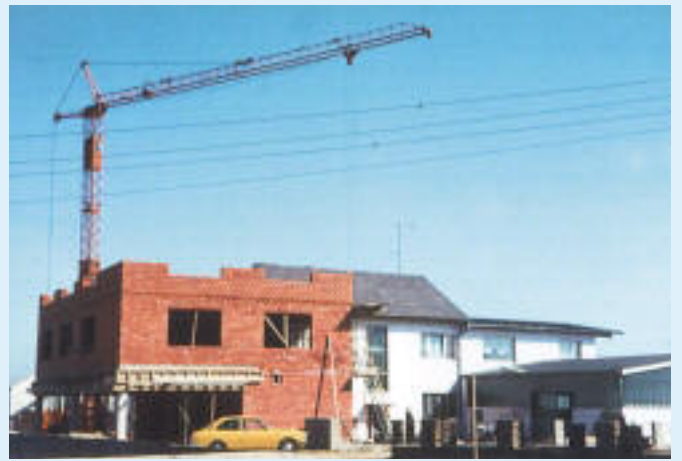
1972 Zubau Schulstraße 5, Geschäft und Wohnungen