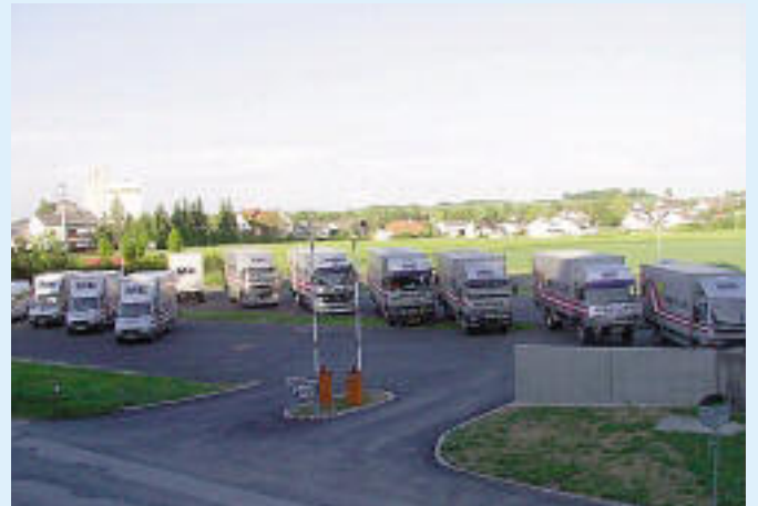
2002 Transport der Verteiler