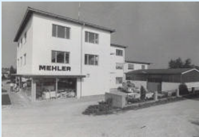
Zubau fertig 1973 Schulstraße 5