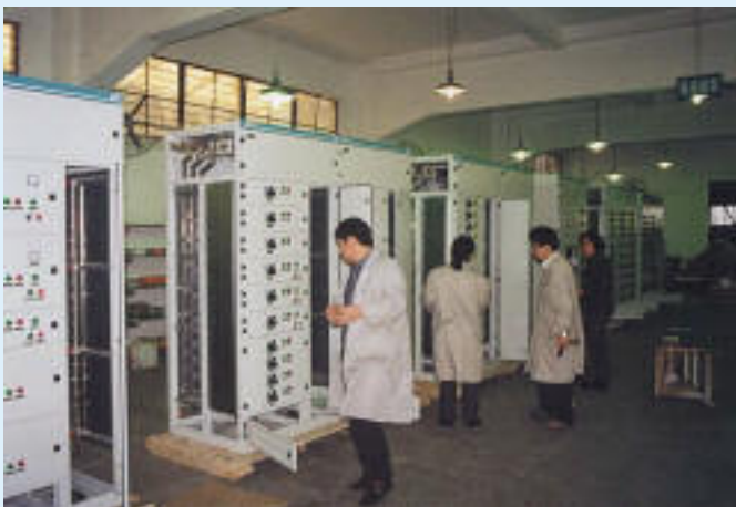
Einschubverteiler in China

1992-2002 Joint Venture Firma 40% Anteile Firma Mehler, 60% Anteile Chinesen Neubau in China ab 2002 100% Anteile Firma Mehler Elektrotechnik, 200 Mitarbeiter