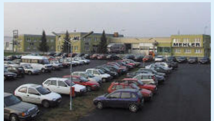
Firmeneigener Parkplatz für 130 PKW